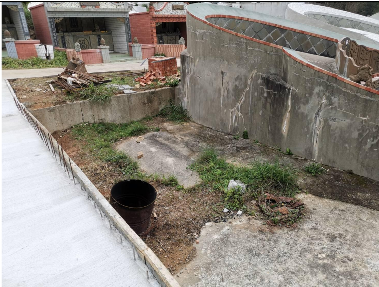
連江縣南竿鄉福沃段 537-8 地號土地