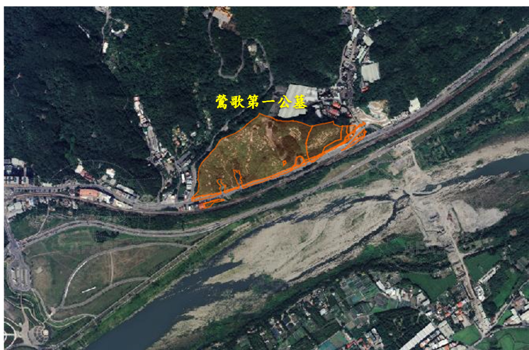
鶯歌第一公墓禁葬範圍示意圖