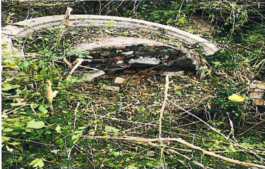
無主墳墓 1 實照圖示