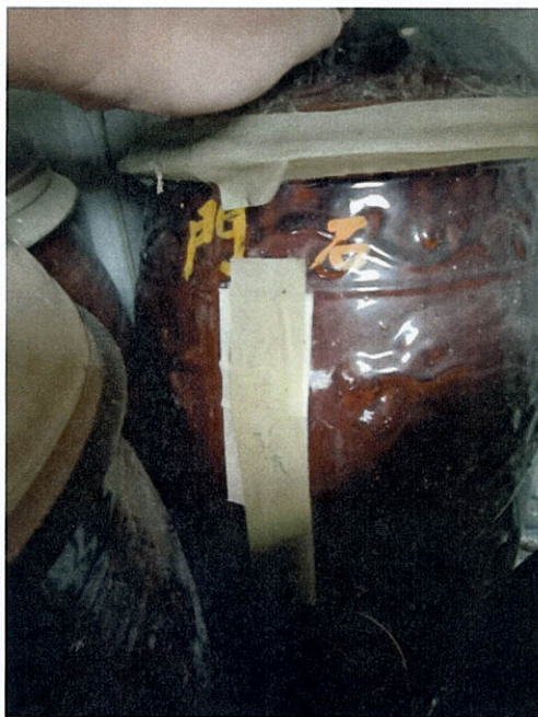
牡丹鄉第二公墓停棺間放置有(無)主骨骸罈 21 罈現場照片