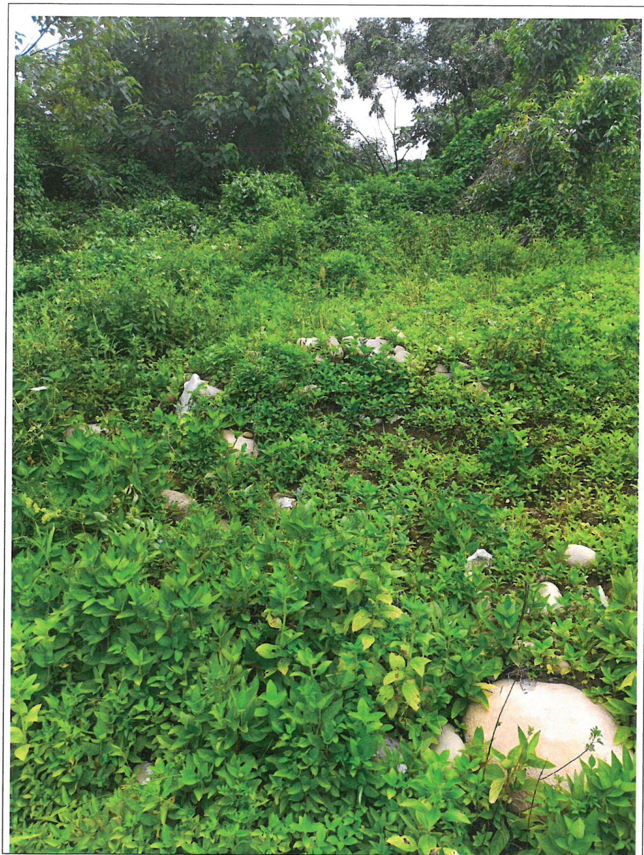
墳墓地點：雲林縣古坑鄉 高厝林子頭段 0012-1245 地號