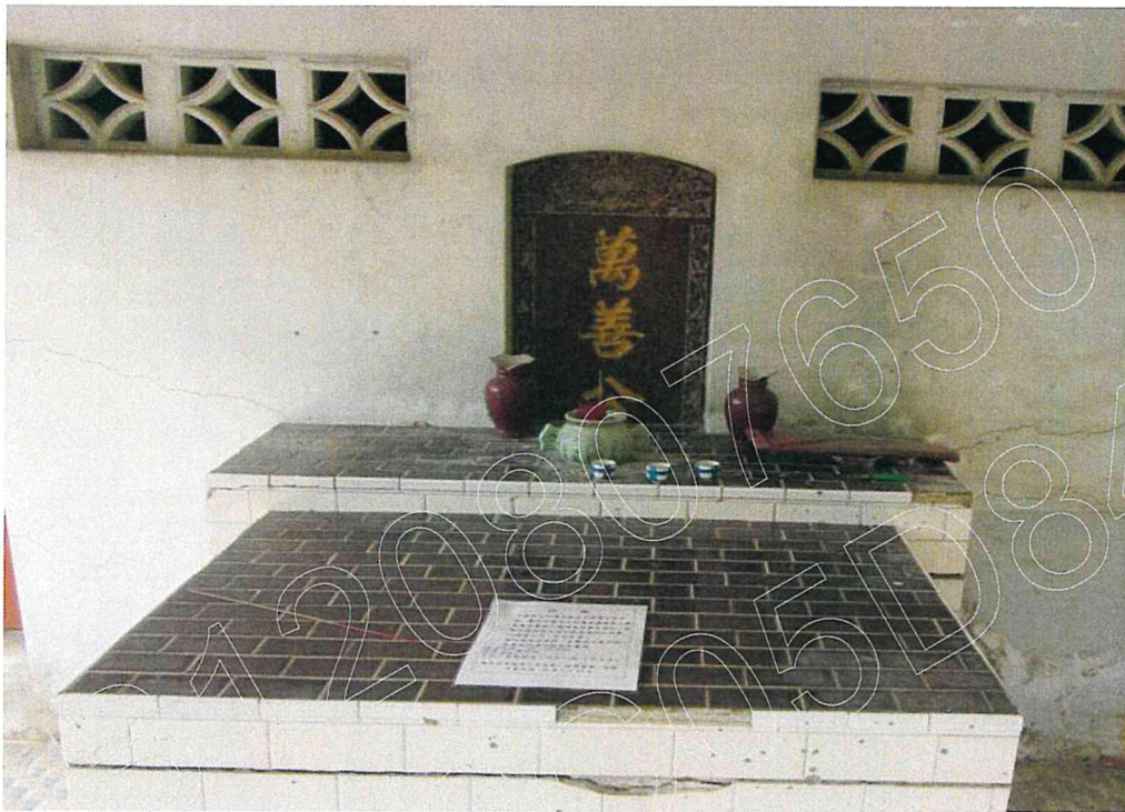
萬善公墓屋現況照片